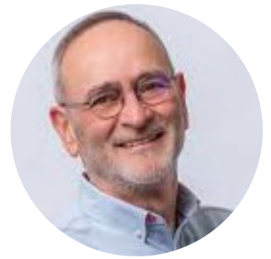
Por: René Saffirio, Gobernador de La Araucanía

Como Gobernador Regional, seguiré defendiendo el derecho de La Araucanía a contar con una red de salud digna, moderna y capaz de responder a las necesidades reales de nuestra