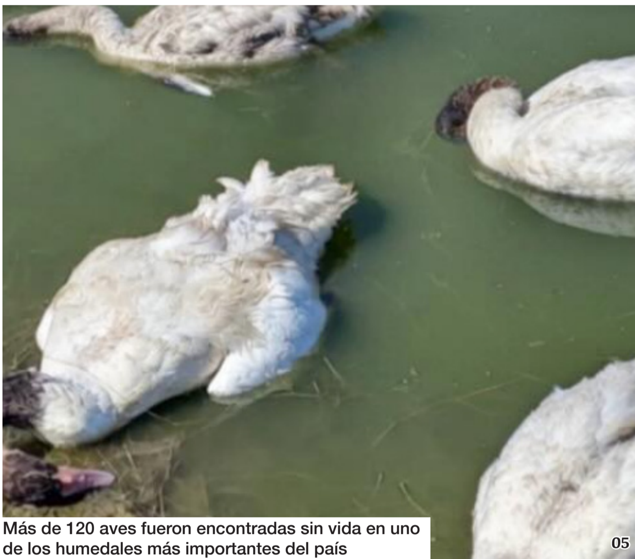
Más de 120 aves fueron encontradas sin vida en uno de los humedales más importantes del país