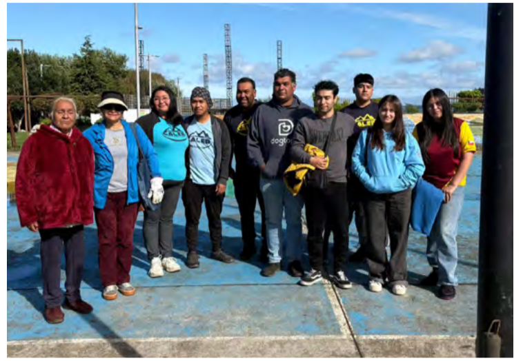
iniciativa, demostrando compromiso y trabajo en conjunto por el bienestar de Puerto Domínguez