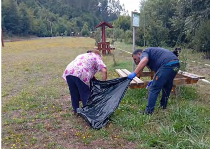
Destacada iniciativa de la Junta de Vecinos Leufu Budi N°8 y a todos los vecinos y vecinas de esta importante

Durante la jornada, las y los participantes colaboraron activamente en la limpieza de distintos espacios públicos, demostrando el compromiso de la comunidad por mantener un entorno más limpio, ordenado y agradable para todos.