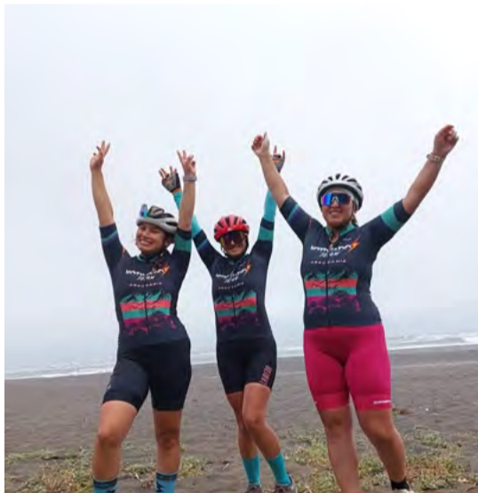
y saludable”, señalaron desde la organización.

“Queremos motivar a más mujeres a subirse a la bicicleta. El ciclismo no es solo de hombres, es un deporte para todos y una excelente forma de mantenerse activa