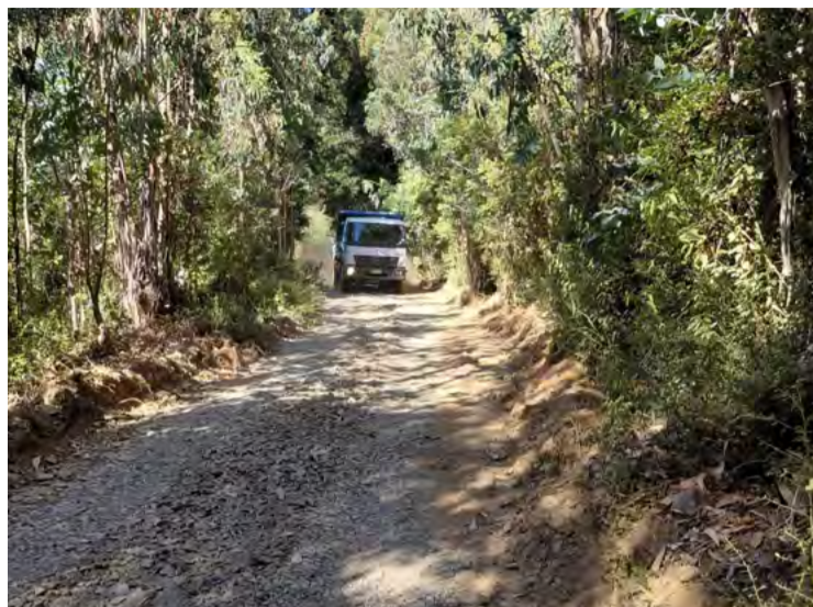
Como respuesta directa a los requerimientos de las familias del territorio, la Municipalidad de Carahue se

encuentra ejecutando un intenso operativo de mantenimiento vial. En esta oportunidad los equipos municipales han intervenido aproximadamente 65 kilómetros de ruta, realizando labores de perfilado y compactado.