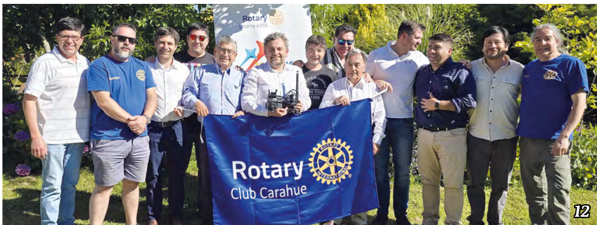
Gobernador del distrito 4355 de Rotary Internacional visitó Club Rotario de Carahue

Comunidades de La Araucanía reciben maquinaria agrícola para fortalecer su capacidad productiva