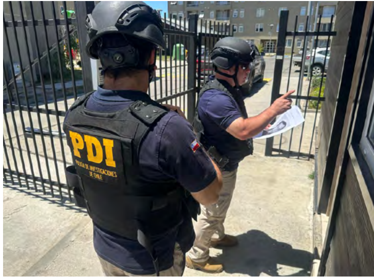
arresto la cual tuvo como objetivo detener a quienes pre-