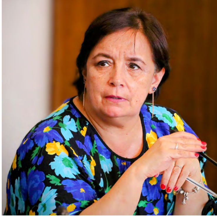
mos dependiendo de la tramitación y consulta excesiva

La legisladora, coautora de proyectos como la Ley de usurpaciones y la Ley Antiterrorista, que han permitido recuperar terrenos para retomar la productividad y generar empleos, cuestionó que “ad portas de 2025, aún segui-