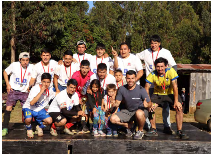
Fue una jornada llena de emoción y compañerismo,