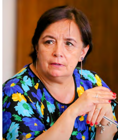
usurpaciones es precisamente porque con este tipo de normativas se ha lo-

grado disminuir la ocurrencia de los atentados en la Macrozona sur, pero claramente no ha sido suficiente para desarticular a las orgánicas radicalizadas que operan en la zona”.