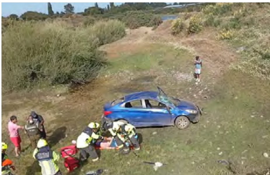
bomberos de la Ciudad Acquarela, ayudando a salir a este pasajero del

Los hechos ocurrieron en el lugar conocido como 'La Junta', donde se unen los caudales del Río Chol-Chol y Río Cautín, en el lugar que es materia de investigación, un automóvil volcó, cayendo a un desnivel de unos 4 metros. Esto debido que es un pozo que se extrae ripio, por lo cual una persona quedó atrapada, debiendo concurrir a dicho lugar la Unidad de Rescate Vehicular de la Segunda Compañía de Bom-