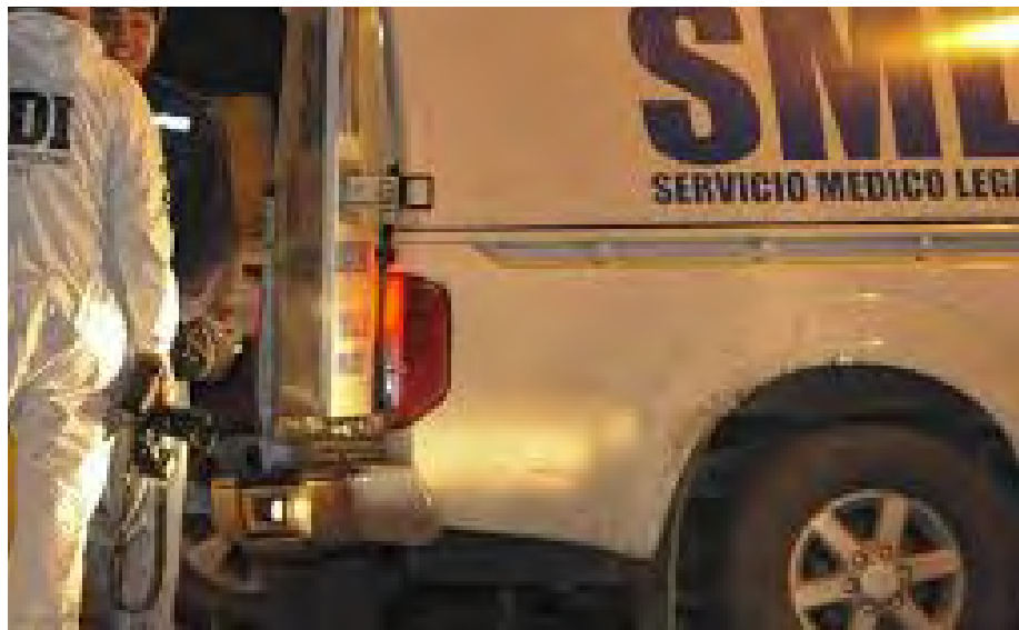
lugar, con la finalidad de verificar la veracidad de lo denunciado, donde al

Comunicando en forma inmediata a Carabineros del hallazgo del cuerpo sin vida, personal de Carabineros concurren en forma inmediata al