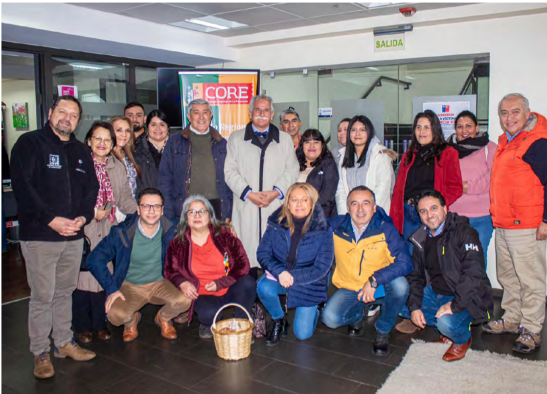
Comisión N°10 del Consejo Regional