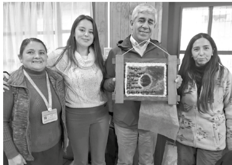
en materia de participación

Los representantes de Saavedra relataron sus diversas experiencia y desafíos