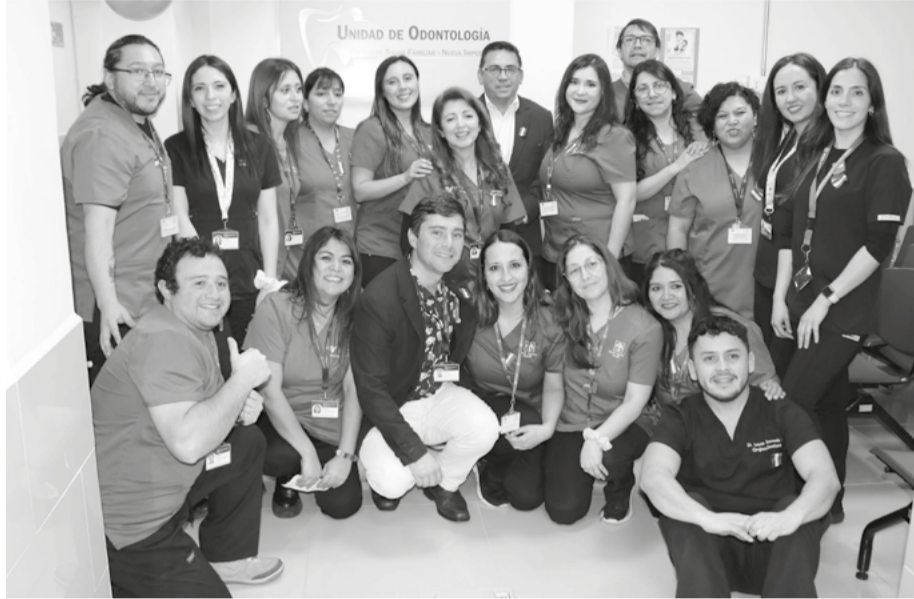
narios y otros invitados especiales. Esta nueva área de odontología, que tuvo un costo de 323.098.580 pesos, fue financiada con recursos