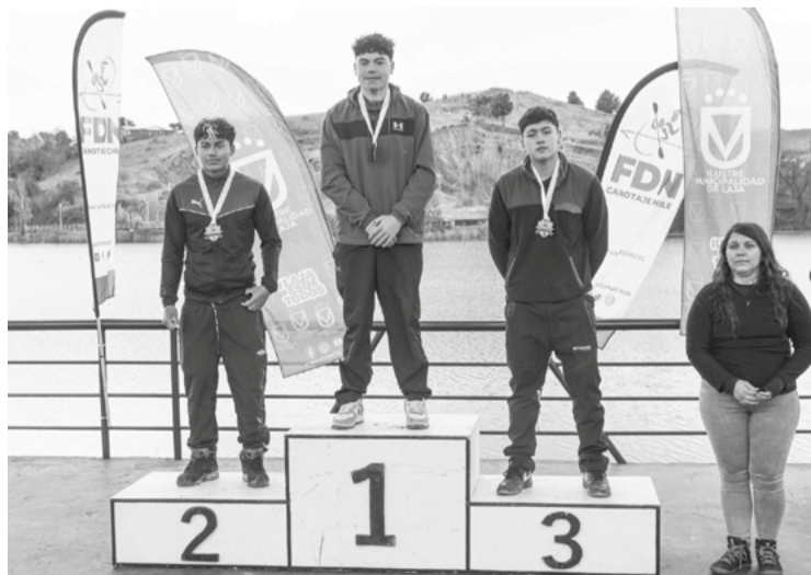
Maratón de Croacia 2024.