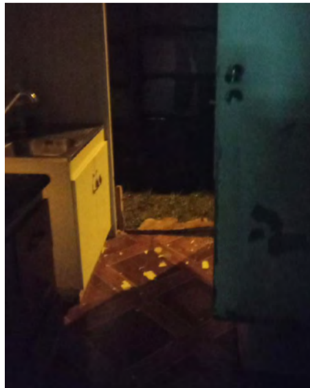
El actuar de vecinos, fue fundamen-

tal para lograr recuperar los artículos sustraídos de la sede social de Villa Renacer, lo que se evaluaría en cerca de un millón y medio en electrodomésticos.