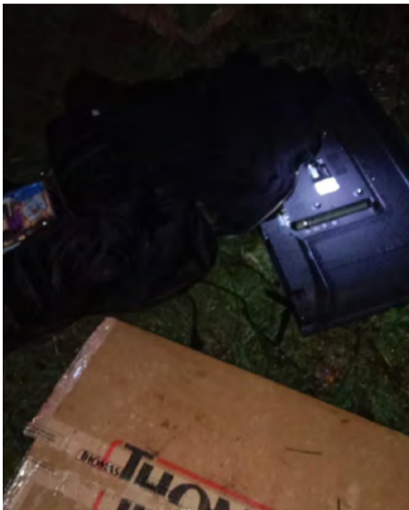
sector de Villa Renacer.

El joven detenido, ya registraba antecedentes por causas anteriores, como porte y tenencia ilegal de armas. En esta ocasión, fue detenido por el delito de robo en lugar no habitado, el cual afectó a una conocida sede social ubicada en el sector oriente de la comuna de Carahue, en