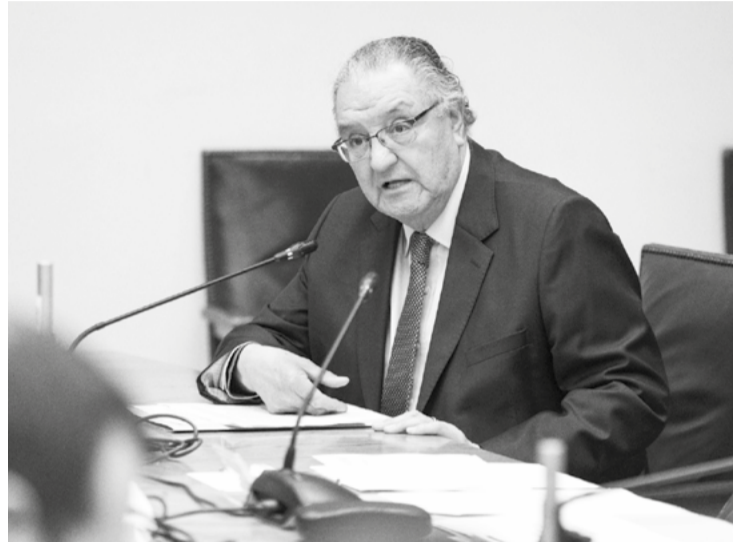
ción también en este caso del Convenio 169 respecto del

Solamente quiero agregar que el 10 de agosto de 2022 se publicó la Ley 21.477 que modificó el Artículo 15 de la Ley 20.234, que viene a ratificar que no es posible la subdivisión cuando se trate de formar loteos inmobiliarios sin cumplir con normativa vigente; entre los cuales está el artículo quinto de la Constitución respecto a los tratados, y por ende la aplica-