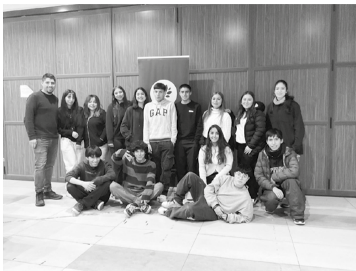
El programa, que cuenta con cupos limitados, contem-

pla clases una vez a la semana de Competencia Lectora y Competencia Matemática M1 desde julio hasta noviembre, con un total de 18 clases intensivas por cada asignatura además de un ensayo mensual por ramo.