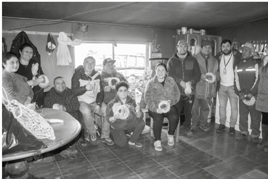
El Programa Municipal de la Mujer,

buscar capacitar a las organizaciones durante todo el año en distintas materias, tales como, artesanía, oficios y manualidades.