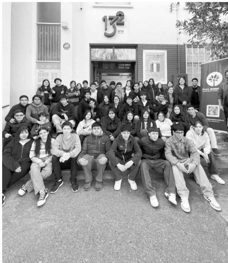
yos, el Preu Araucanía, preuniversitario social más grande

la región, abrió la inscripción para su Plan Intensivo 2024 destinado a los alumnos de Temuco que busquen preparar la PAES de este año.