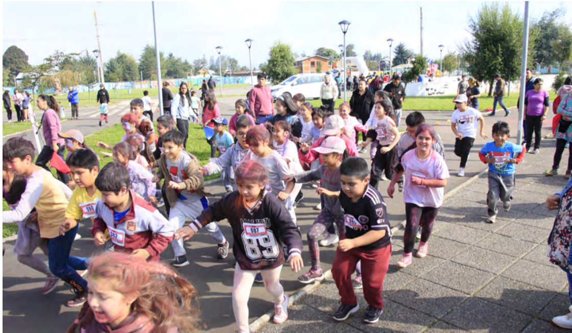
Los estudiantes del colegio Juan XXIII, de Nueva Imperial,

vibraron con la energía y el color de la Corrida Escolar.