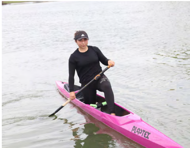
Los cinco deportistas pertenecen al Club de Kayak de

Nueva Imperial, ganaron su derecho en la cita continental,