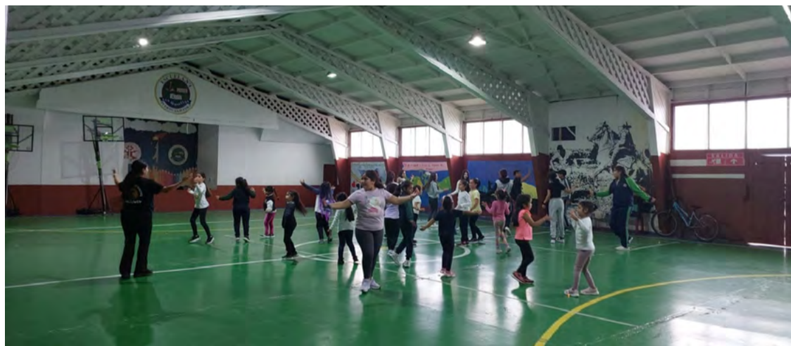
Niños y Niñas de la comuna de Saavedra participaron