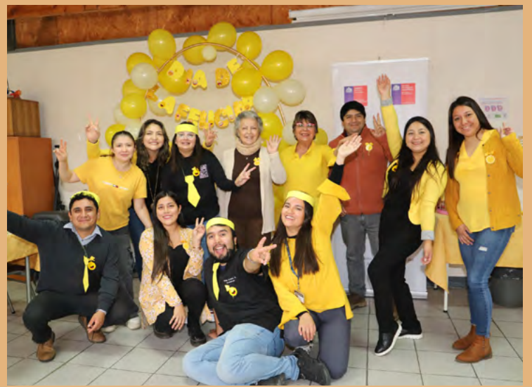
res de dicho programa.

del Departamento del Adulto Mayor de Nueva Imperial, organizaron un taller especial dedicado al Día de la Felicidad para los adultos mayo-