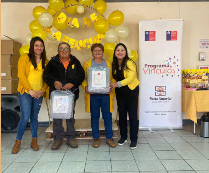
En el marco del programa Vínculos, los profesionales

del Departamento del Adulto Mayor de Nueva Imperial, organizaron un taller especial dedicado al Día de la Felicidad para los adultos mayo-