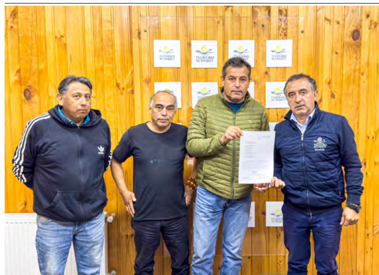
Recientemente en el salón de alcaldía, de Teodoro Sch-