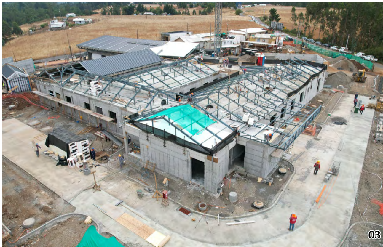
Financiadas con fondos del GORE Araucanía y ejecutadas por la Dirección de Arquitectura del MOP