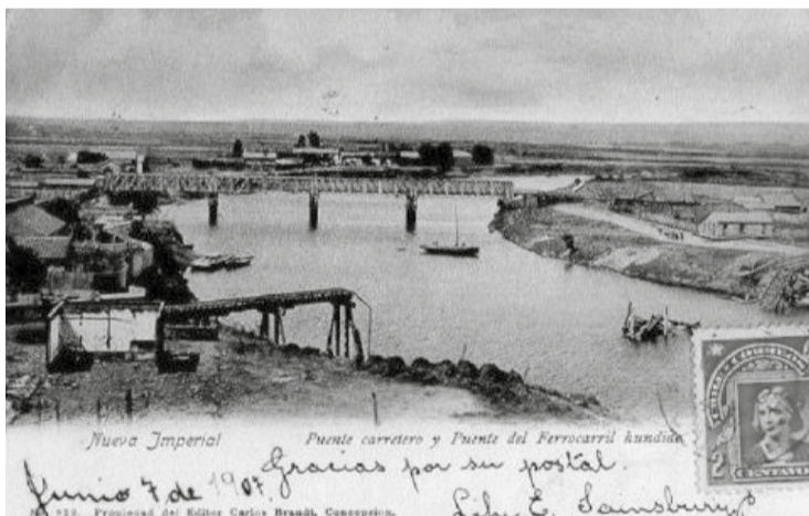
Nueva Imperial. Puente carretero y puente del ferrocarril hundido. Río Cholchol. c.1905. Postal eBay. (Aporte de Raul Moroni)

Quien delinea la ruta en primera instancia, fue el cono-