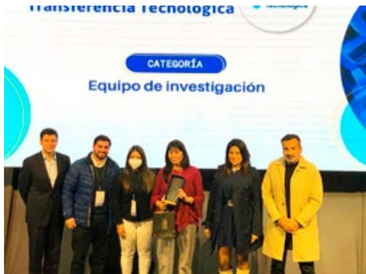
En ese contexto, el direc-

En la ceremonia de premiación, recibieron este re-