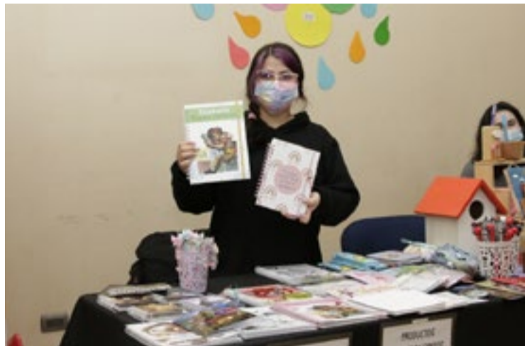
En dependencias del Centro Cultural de Nueva Imperial

rial se está desarrollando la actividad denominada, Fiesta Acuarela:” Aprende en Colores” que es organizada por la Municipalidad a través del Departamento de Cultura.