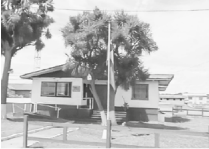
apoyo a voluntarios del Cuerpo de Bomberos de Puerto Saavedra, quienes respondieron al llamado solicitado, lo-

Este macabro hecho, ocurrió en el sector de Punta Mallay, en la Isla Huapi en comuna de Saavedra. Carabineros, recibió una denuncia sobre una persona que se encontraba flotando en un pozo. Tras recibir esta información, carabineros se trasladó hasta el lugar, corroborando la información. Carabineros, solicitó