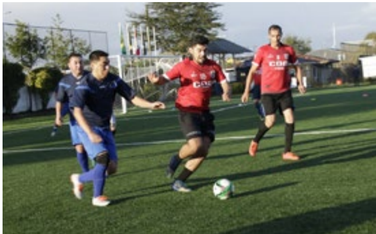
primero y segundo lugar.

La modalidad del cuadrangular fue, los dos perdedores disputan el tercer y cuarto lugar, y por consiguiente los dos ganadores disputaran el