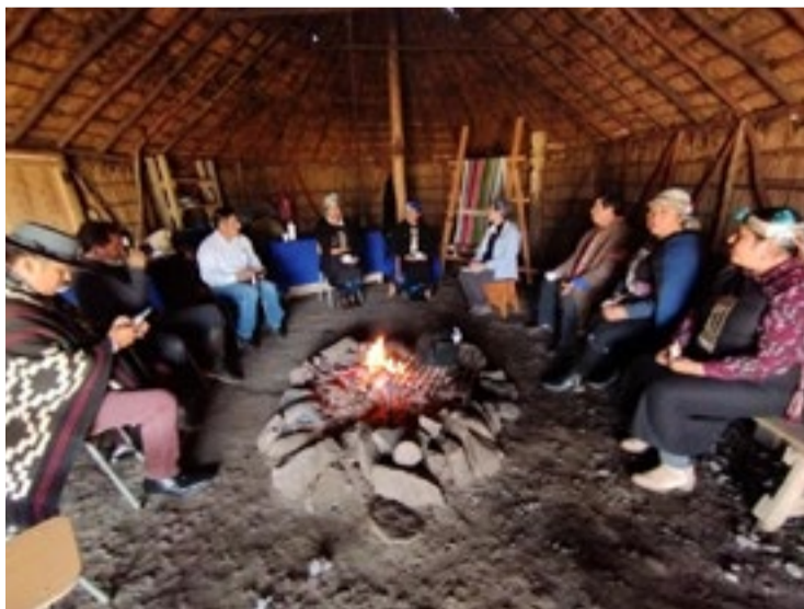
del Relmu Witral en el territorio Lafkenche.