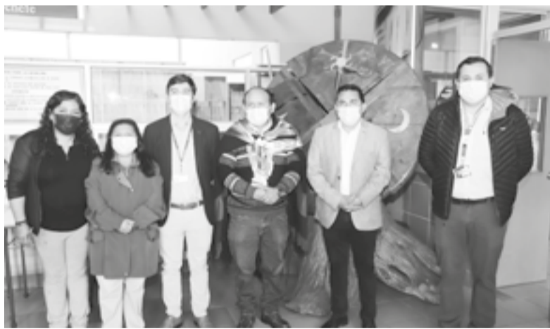
el mismo Centro de Medicina Mapuche.