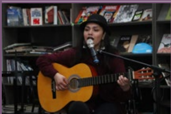
Paloma Nahuelhuen cantautora Mapuche.