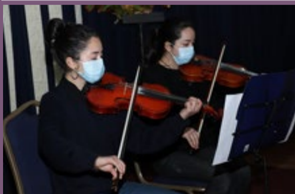
Dúo de Violín.