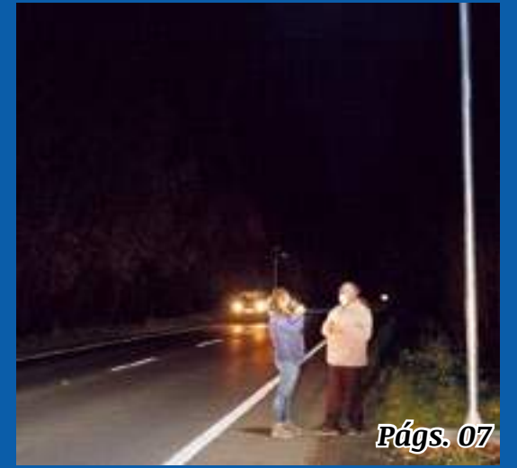
Alcalde Salas inspeccionó luminarias públicas del camino Nueva Imperial – Villa Almagro