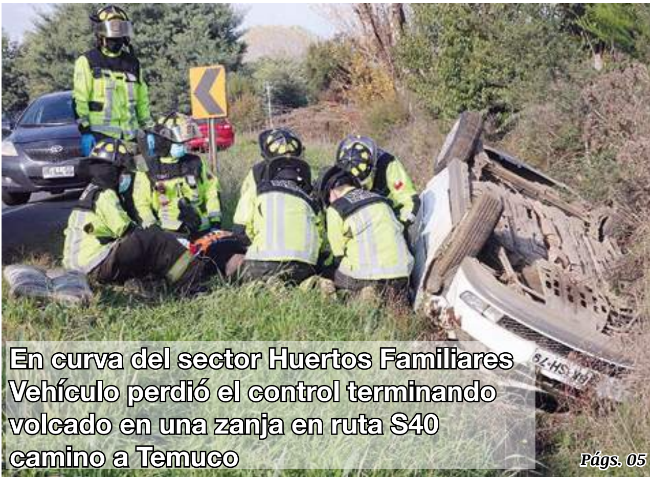
En curva del sector Huertos Familiares Vehículo perdió el control terminando volcado en una zanja en ruta S40 camino a Temuco