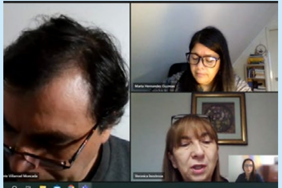
Nahuelbuta y Costa Araucanía orientar las acciones de promoción y difusión de la oferta turística con mayor precisión.