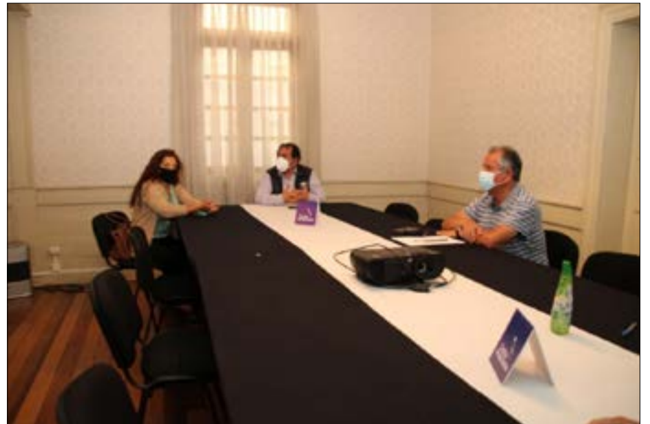
El alcalde comprometió a un equipo de profesionales de la municipalidad que se encargará de postular un proyecto FNDR que permita conseguir los recursos necesarios para su materialización.