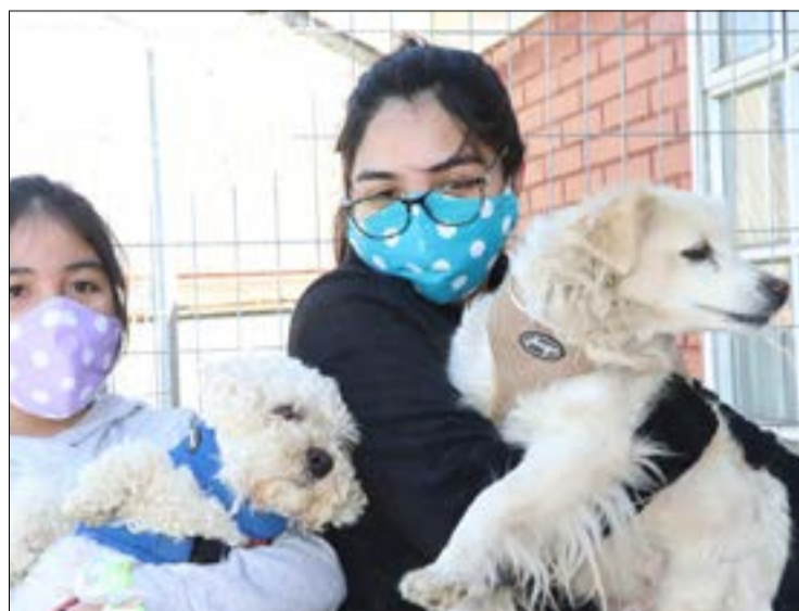
bir la mascota en sus respectivas sedes de sus respectivas juntas de vecinos de su sector.