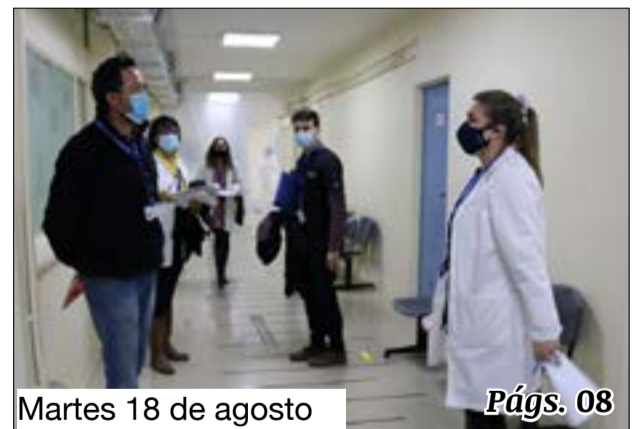
Martes 18 de agosto