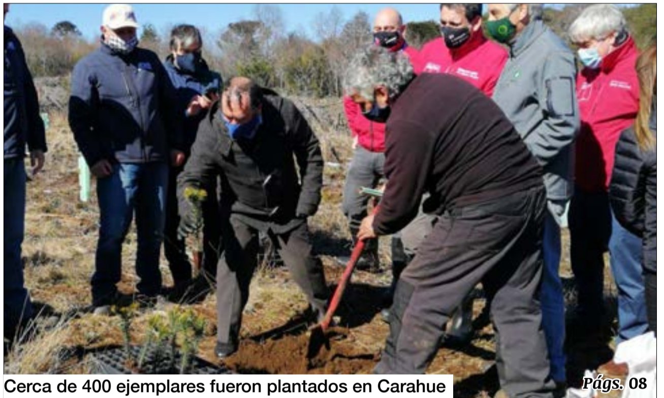
Cerca de 400 ejemplares fueron plantados en Carahue