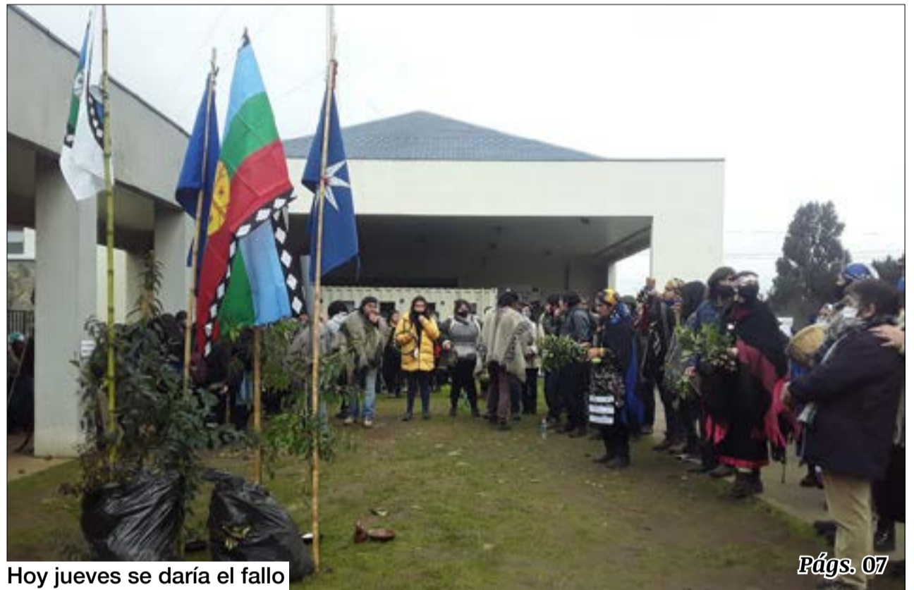
Hoy jueves se daría el fallo