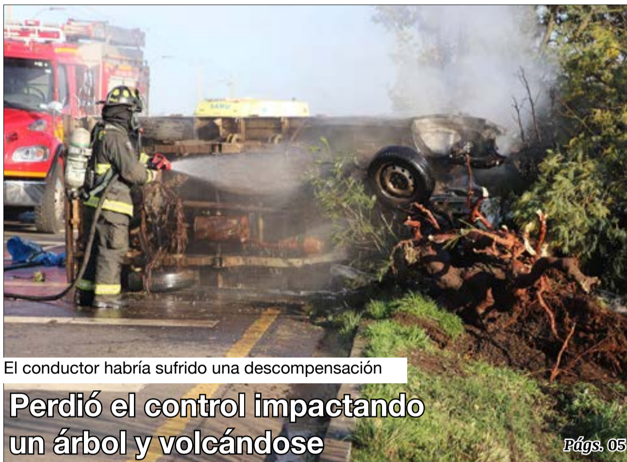
El conductor habría sufrido una descompensación

Perdió el control impactando un árbol y volcándose